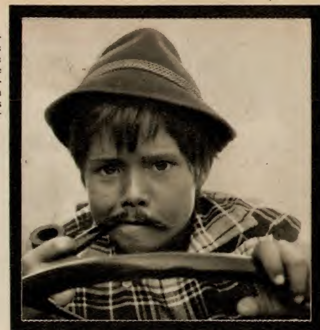
Keine Angst, ihr Jugendschützer. Ich rauche nicht! Die Pfeife gehört dem Fuchsberger und der Schnurrbart auch nicht mir.